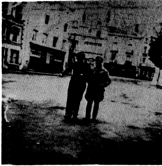
דער דאקטער גאדאין, א בעסארבער ייד מיט גרעגארן. קראפאן, לואר. אקטאבער 1944 פראנקרייך.